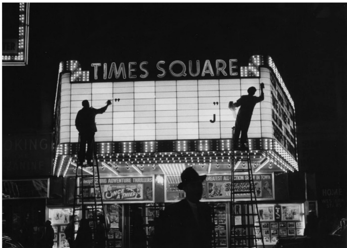
New York, 1955 Tirage gélatino-argentique postérieur

La Galerie les Douches réunit Vivian Maier et Sabine Weiss avec « Made in USA », à découvrir jusqu'au 26 mai 2024. L'exposition se focalise sur le travail photographique qu'elles ont pu effectuer dans les rues des grandes villes américaines au fil des années 1950, 1960, et 1970, avec tout ce que ces villes ont pu leur apporter comme langage esthétique .