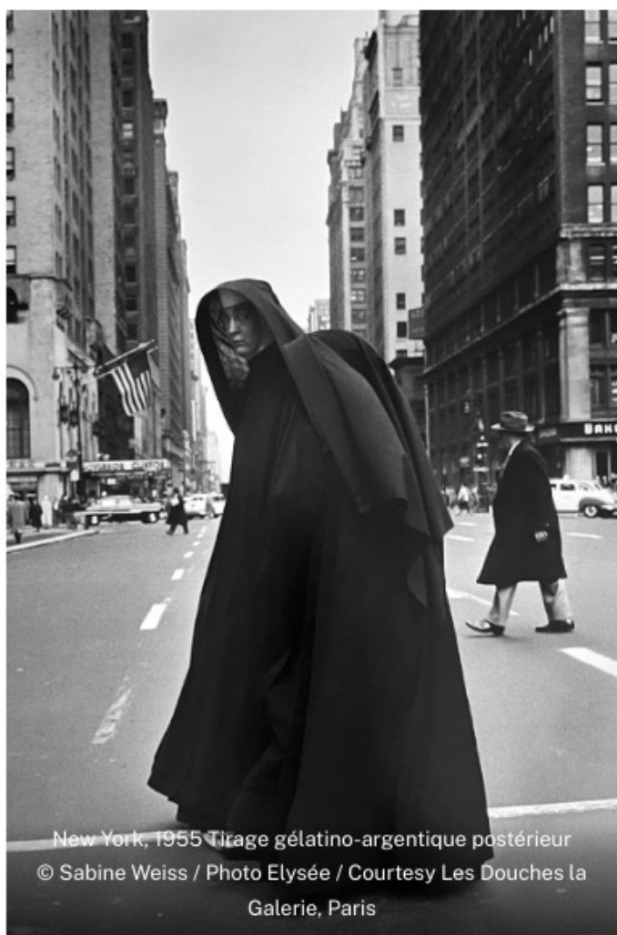
New York, 1955 Tirage gélatino-argentique postérieur