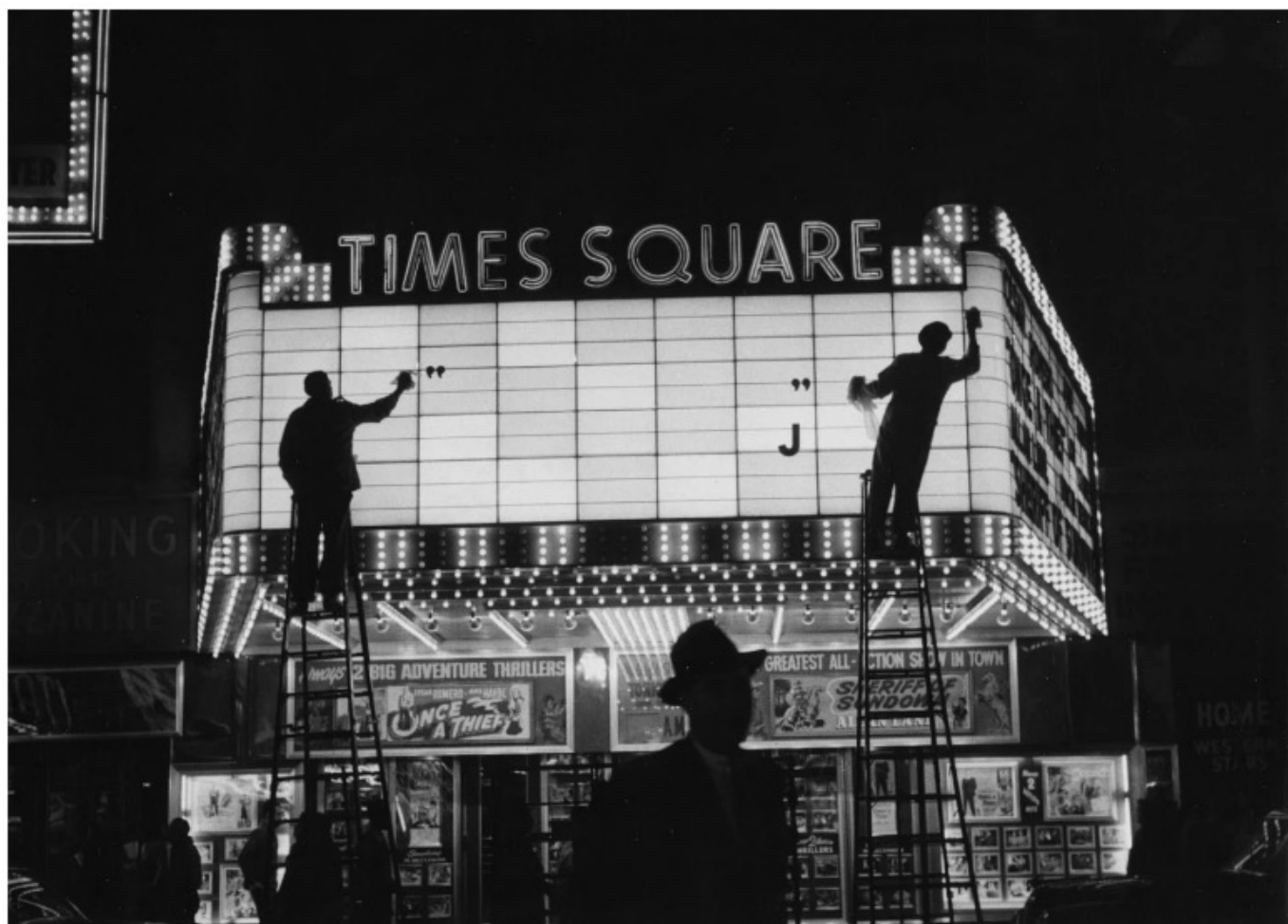
New York, 1955 Tirage gélatino-argentique postérieur

La Galerie les Douches réunit Vivian Maier et Sabine Weiss avec « Made in USA », à découvrir jusqu'au 26 mai 2024. L'exposition se focalise sur le travail photographique qu'elles ont pu effectuer dans les rues des grandes villes américaines au fil des années 1950, 1960, et 1970, avec tout ce que ces villes ont pu leur apporter comme langage esthétique .