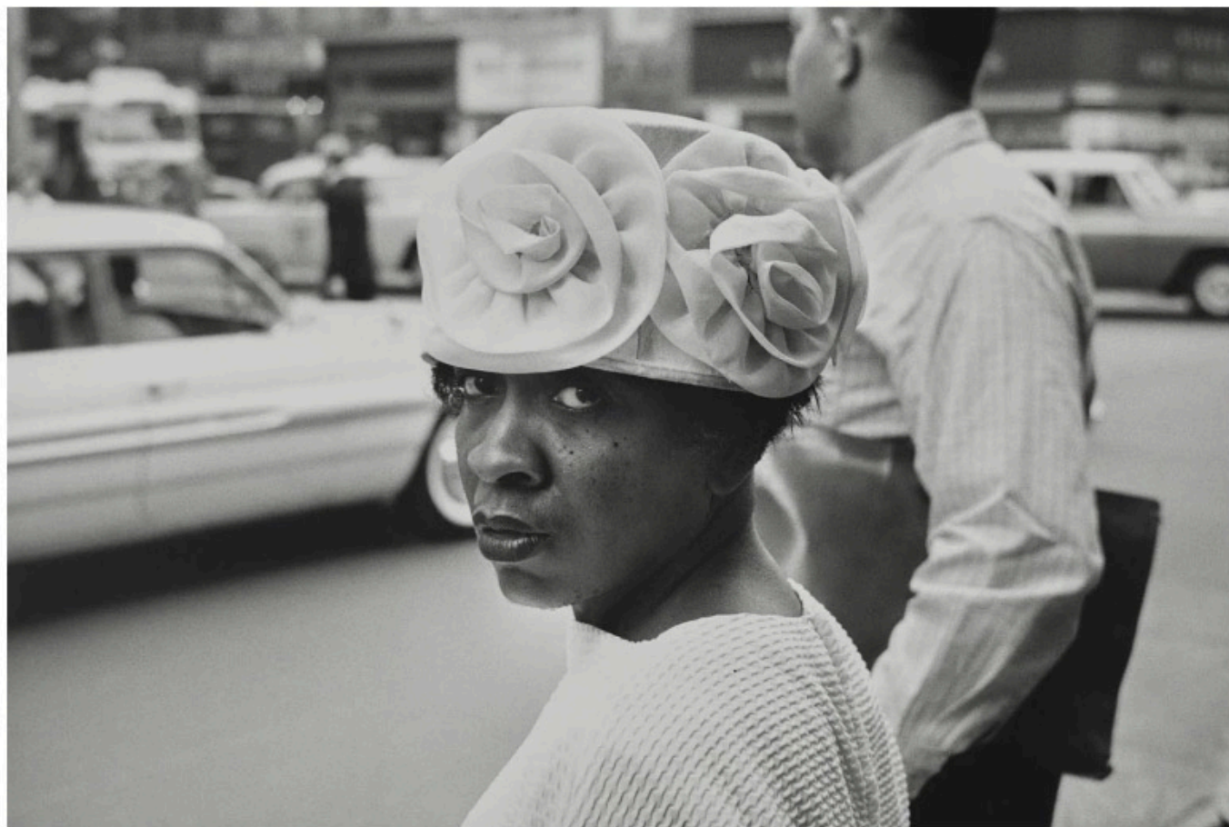
Chicago, 1961 Tirage gélatino-argentique posthume, réalisé en 2023