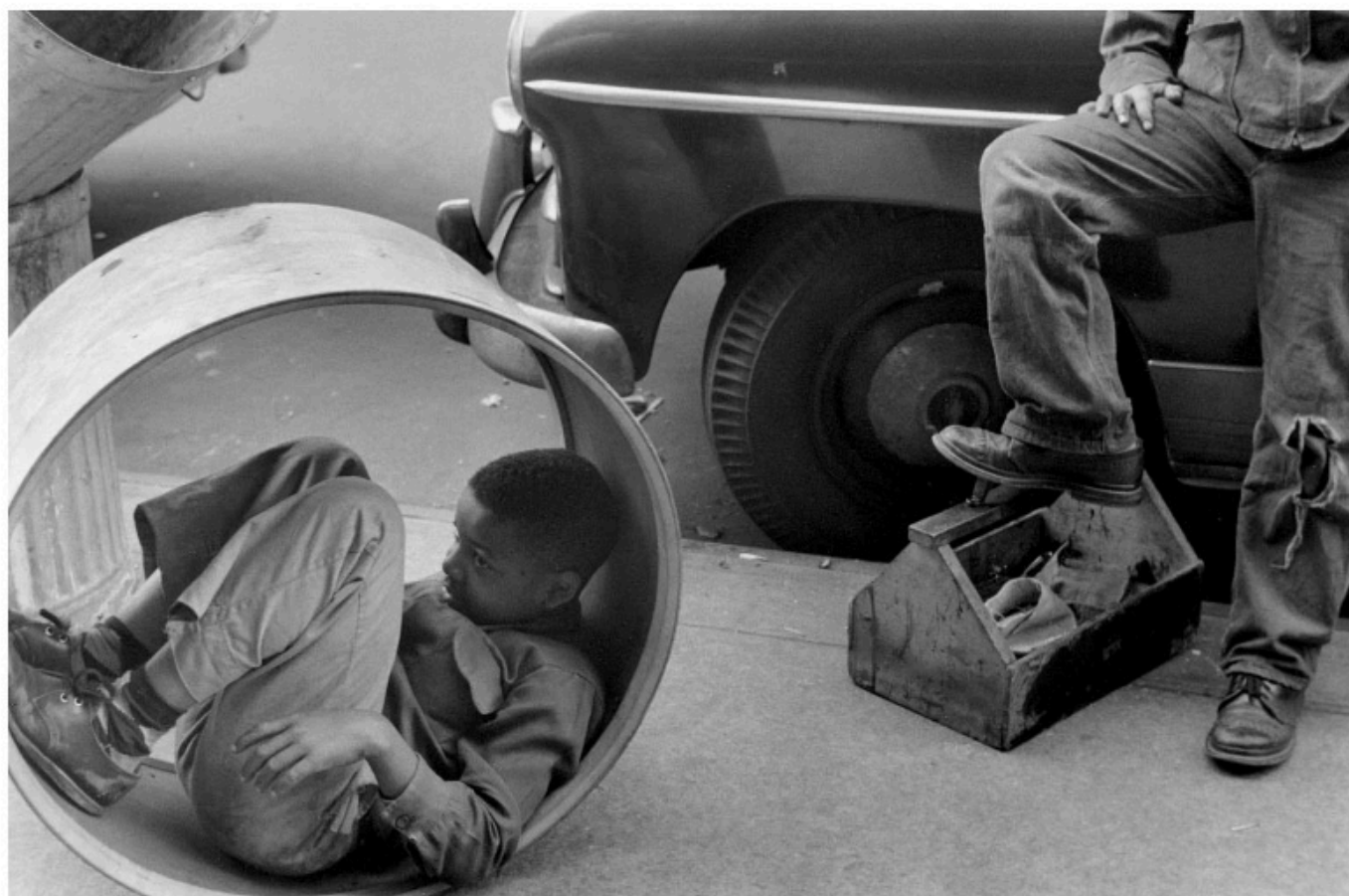
New York, 1955 Tirage gélatino-argentique postérieur

À bien y réfléchir, réunir Vivian Maier et Sabine Weiss paraît aujourd'hui comme une évidence. L'une et l'autre considéraient la photographie comme nécessaire, avec un sens aigu de la composition , et un art du portrait qui démontre une profonde empathie pour leurs sujets.