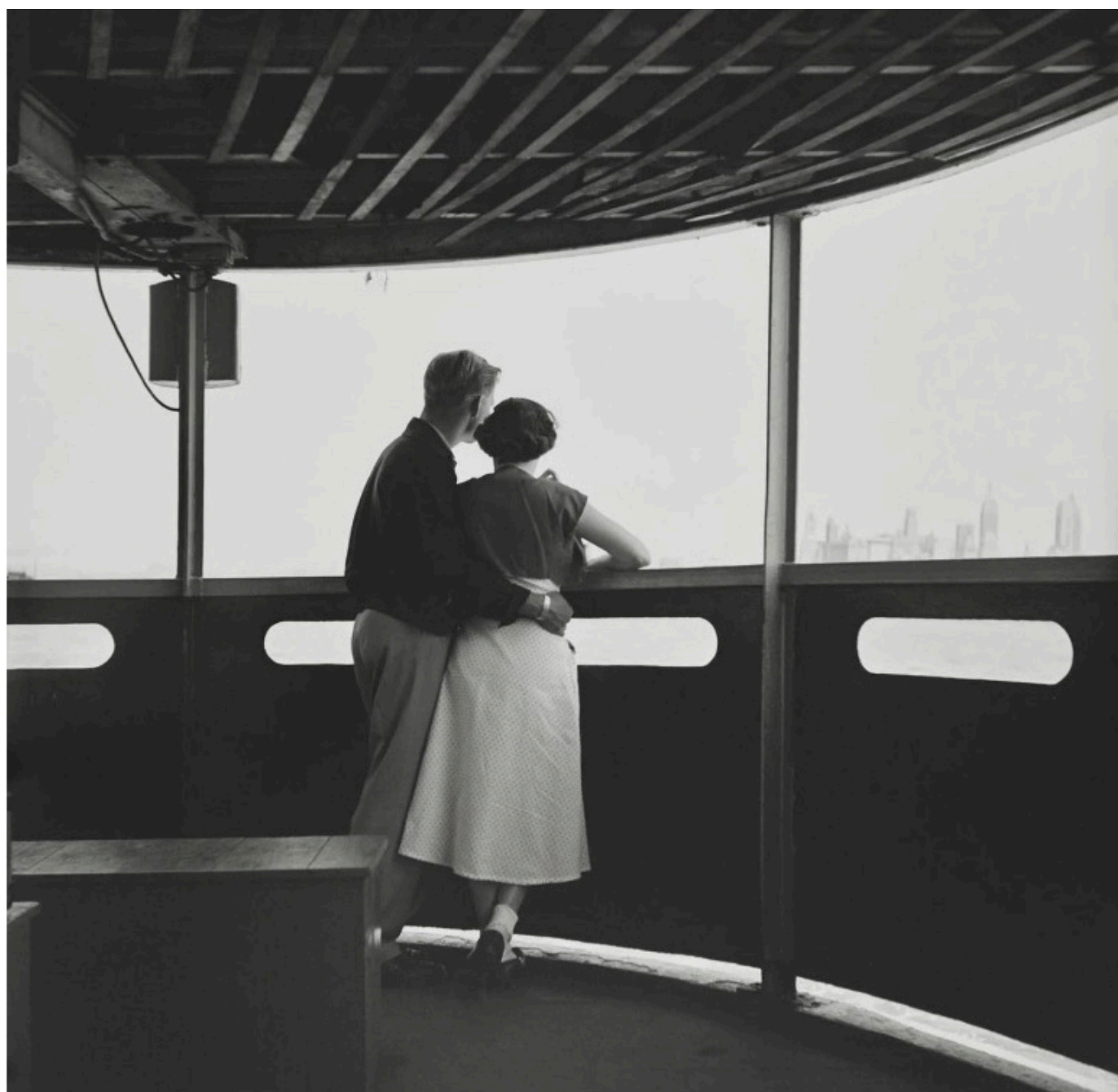
New York, 1953 Tirage gélatino-argentique posthume, réalisé en 2023