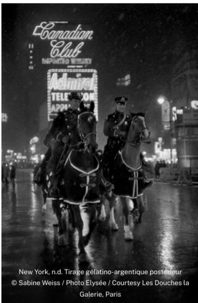
New York, n.d. Tirage gélatino-argentique postérieur