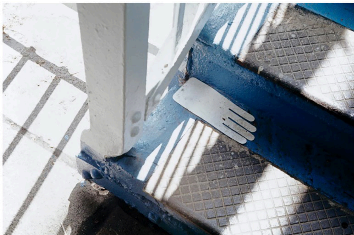
Chicago, 1976 Tirage pigmentaire posthume, réalisé en 2024

Et puis, au milieu de toutes ces photographies en noir et blanc se détachent quelques-unes en couleur , par Vivian Maier, en plein cœur des années 1970, qui ne donne rien à envier à un Harry Gruyaert ou un à William Eggleston . C'est aussi une certaine histoire des grandes villes américaines qui se dessine derrière chaque image, à travers les visages , vêtements et usages photographiés.