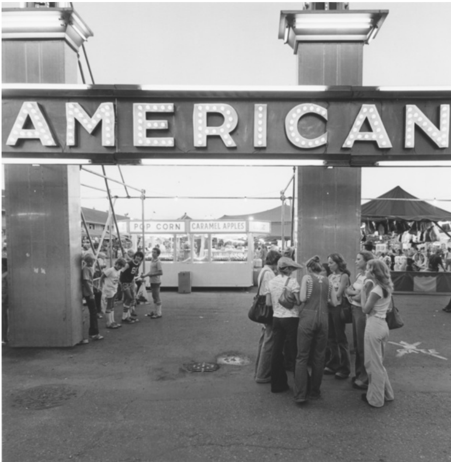
Tom Arndt, Minnesota St Fair , 1976 Tirage gélantino-argentique moderne — 27,9 × 35,3 cm

Fidèle au noir et blanc, Arndt est un classique. Il a beau tordre les perspectives ou faire vaciller les cadres, à la façon de la Nouvelle Objectivité ou de l'expressionnisme, il reste un moderne en sourdine qui ne s'y engouffre pas à tout prix et regardera toujours la couleur comme un obstacle. Aussi, ses images d'aujourd'hui ont-elles un pied dans le passé. Les deux jeunes enfants dans la pelouse, de dos en 2008 semblent avoir traversé le temps depuis les années 50. Voilà peut-être ce que l'on nomme un sentiment d'éternité.