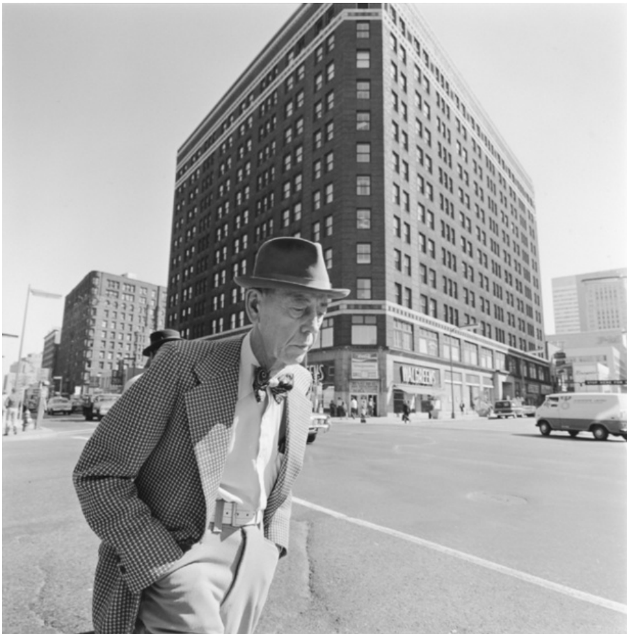
Tom Arndt, Man with a bow tie, 6th J Hennepin, Minneapolis, Minnesota, 1975 Tirage gélatino-argentique moderne — 27,9 × 35,3 cm — n°1/15

Bienveillante, aimante, nécessairement humaine. Sur les foules, les grands rassemblements populaires ou les portraits plus individuels, Arndt pose un regard attendri, sans ironie aucune. Premier degré. Sans double lecture, ainsi se présente le réel de ce photographe contemporain de Robert Frank avec qui il collabora un temps. Certaines de ses prises partagent d'ailleurs les mêmes lignes, le même esprit. Notamment, cette façade d'où quelques têtes émergent par une fenêtre, sous une bannière étoilée. On croirait voir un cliché de The Americans . Puis ces « Américains » disparaissent, s'estompent peu à peu, laissant place à un monde dépeuplé, plus flou, plus poétique aussi. Les images sont auréolées de buée, de fumée, les contours sont moins nets et la dynamique est encore plus personnelle. Le style évolue sans pour autant se travestir.