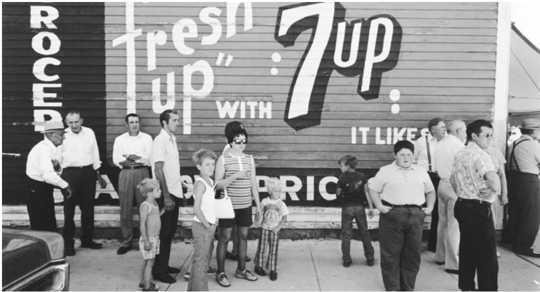
Tom Arndt, Bicentennial Fete, Browerville, Minnesota, 1976