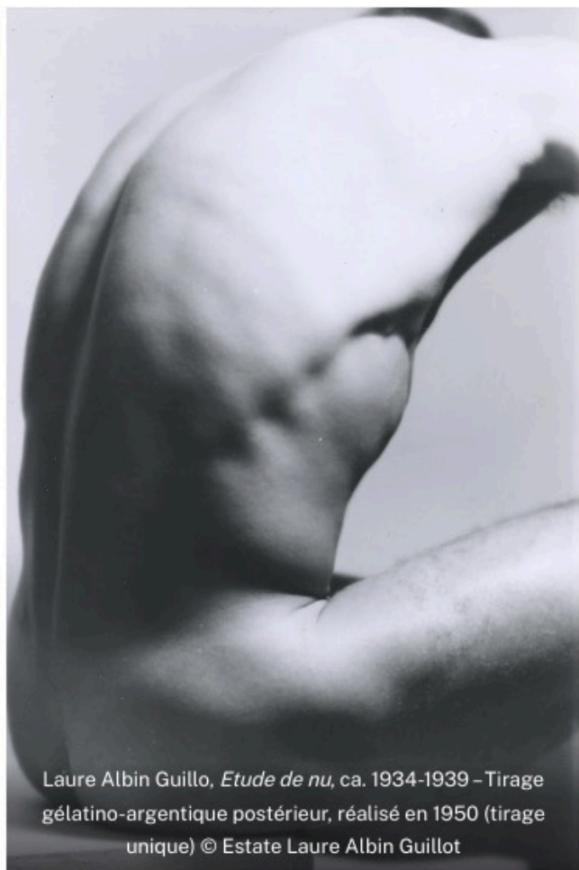
Laure Albin Guillo, Etude de nu, ca. 1934-1939 – Tirage gélatino-argentique postérieur, réalisé en 1950 (tirage unique)