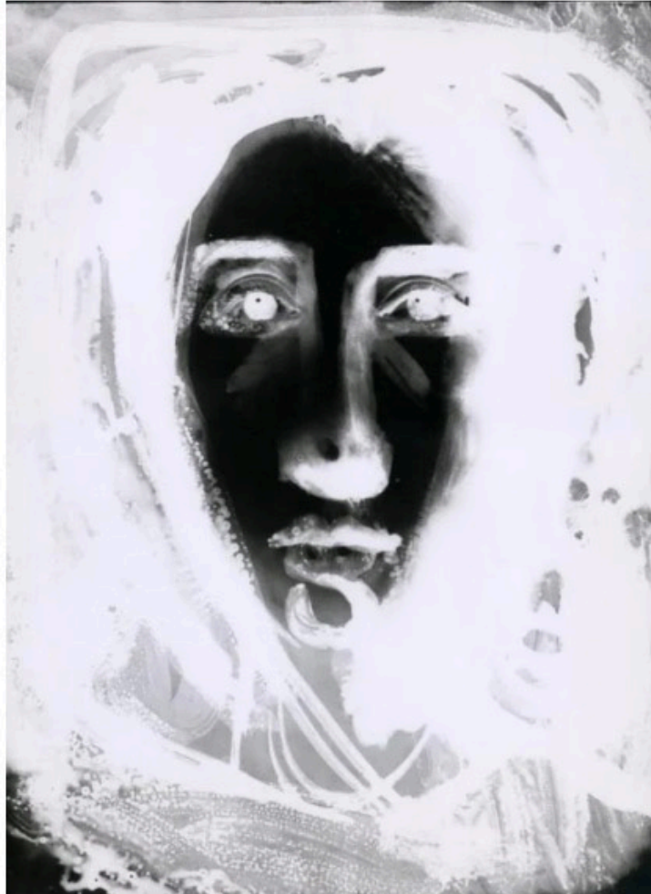
Roger Catherineau, Sans titre , ca. 1962

Tirage gélatino-argentique d'époque, réalisé par l'artiste avec retouche à la peinture noire