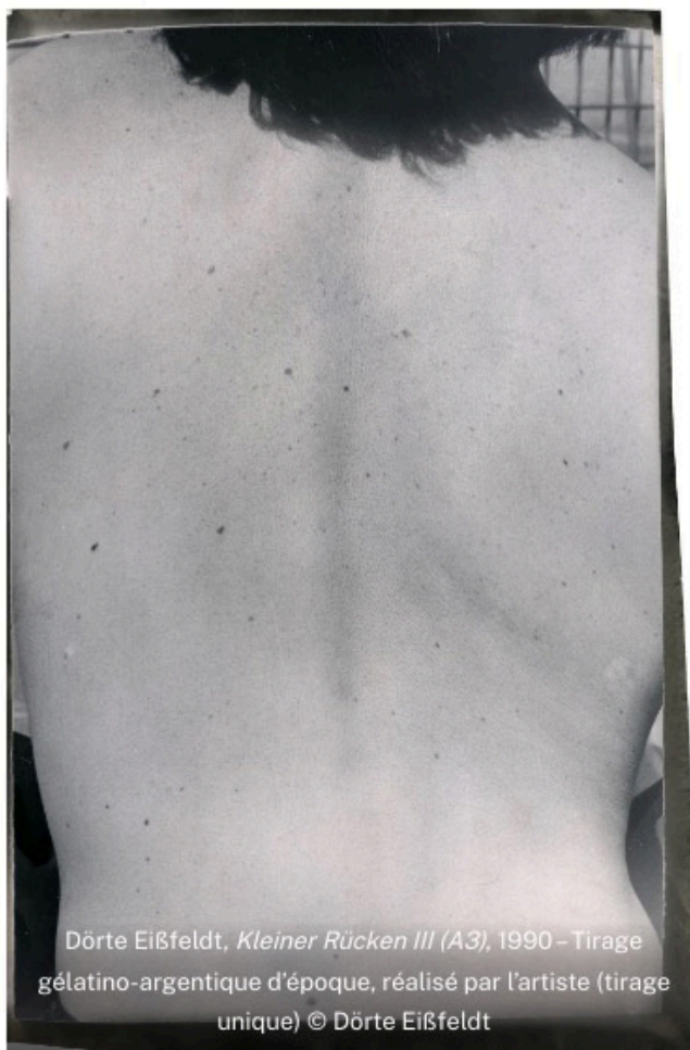
Dörte Eißfeldt, Kleiner Rücken III (A3) , 1990 – Tirage gélatino-argentique d'époque, réalisé par l'artiste (tirage unique)