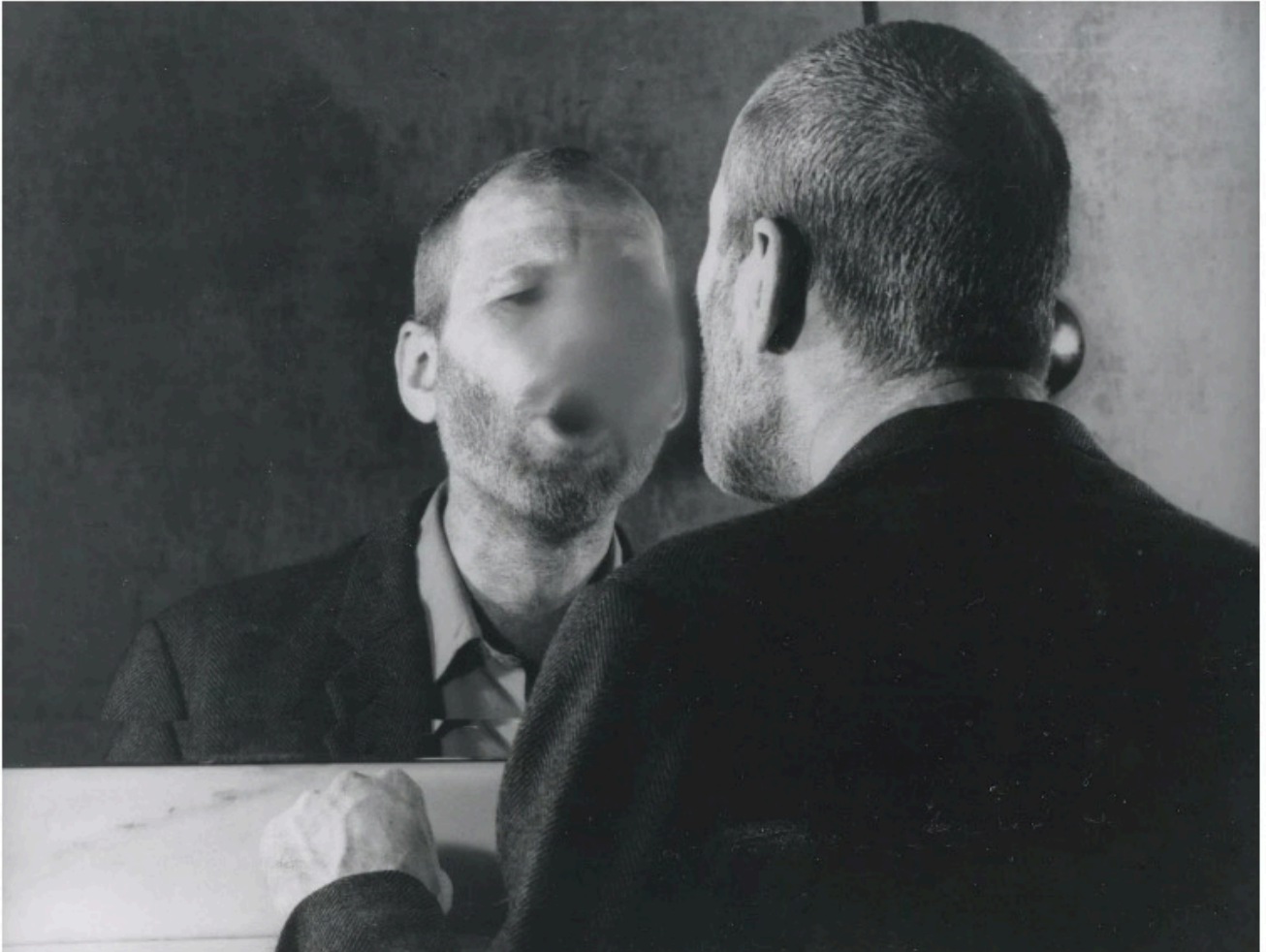
Dieter Appelt, Der Fleck auf dem Spiegel, den der Atemhauch schafft (La tache que le souffle produit sur le miroir), 1977 – Tirage gélatino-argentique d'époque