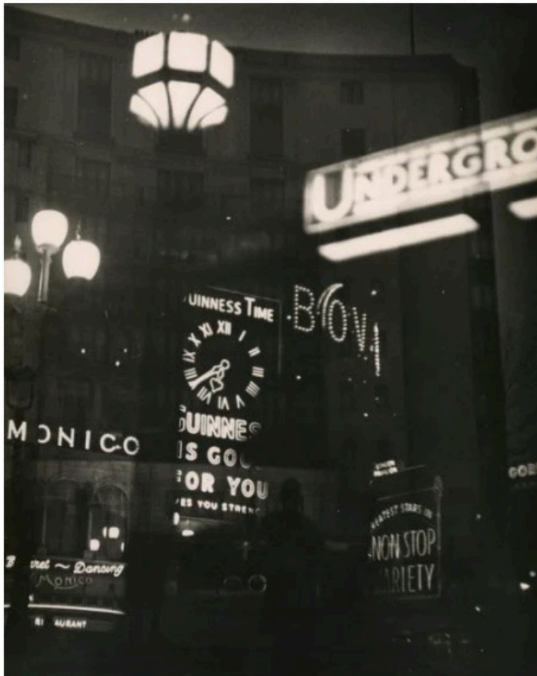
Brigitte Moral, Londres , 1934

Tirage gélatino-argentique d'époque (tirage unique)