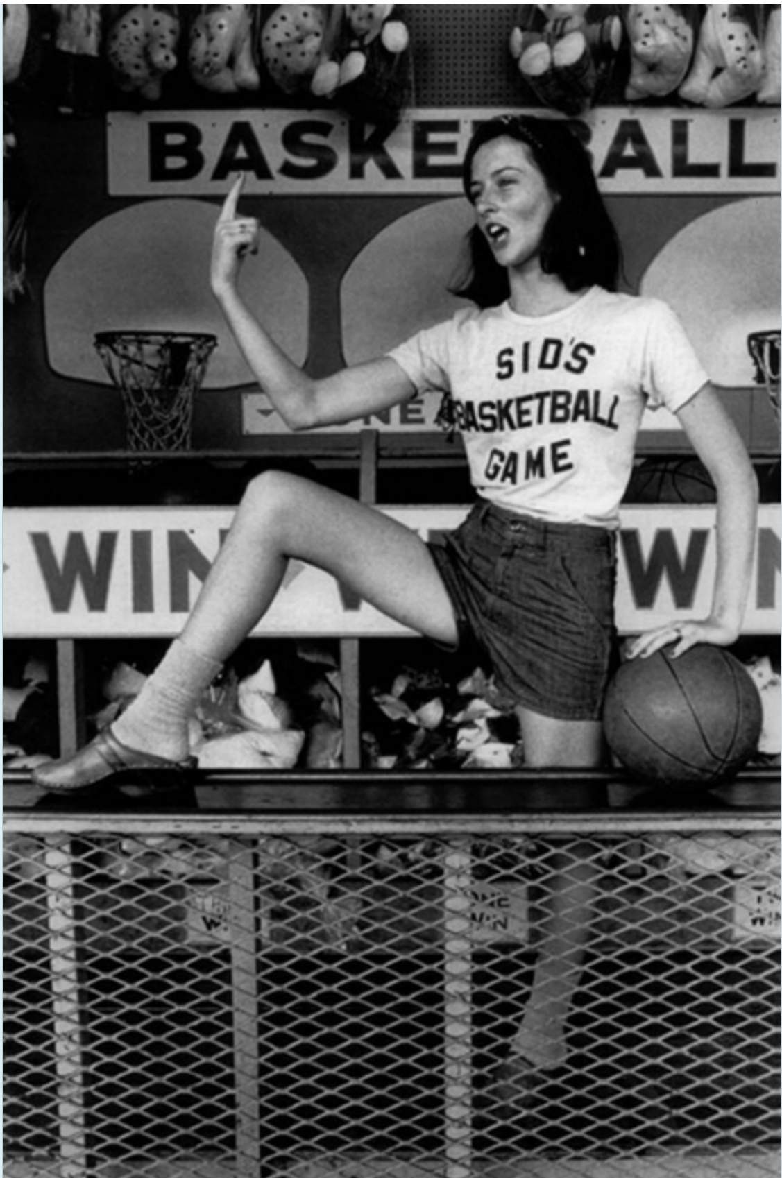
Sid's Basketball Game, Coney Island, New York, 1976.

Jusqu'au 5 mars. Les Douches la galerie, ouverte du mercredi au samedi de 14h à 19h et sur rendez-vous. 5 rue Legouvé, 10e.