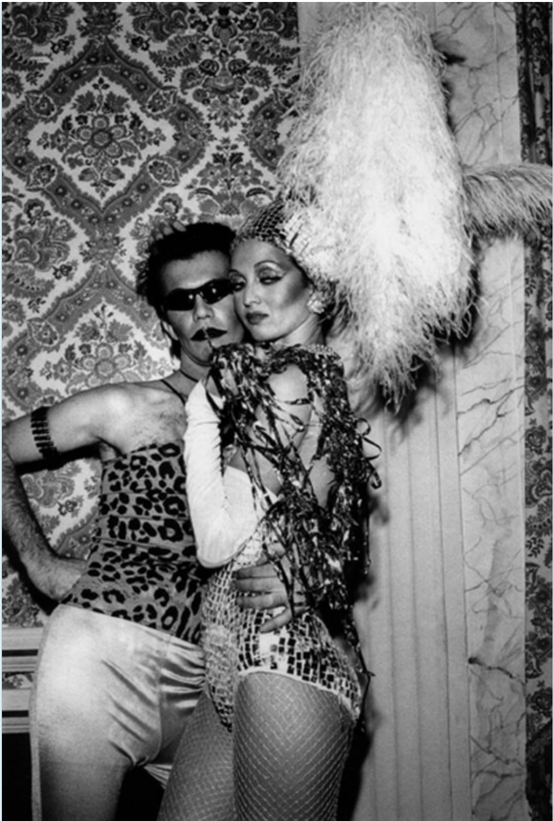
Brazilian Carnival, Waldorf-Astoria, New York, 1979.

“L’été, je retournais sur les plages de mon enfance, Coney Island et Brighton Beach. J’ai des souvenirs intacts de ces plages, j’y suis très attachée et j’y vais toujours. J’ai fait des photos à Bay One, la plage nudiste de Riis Beach – la seule de tout New York”