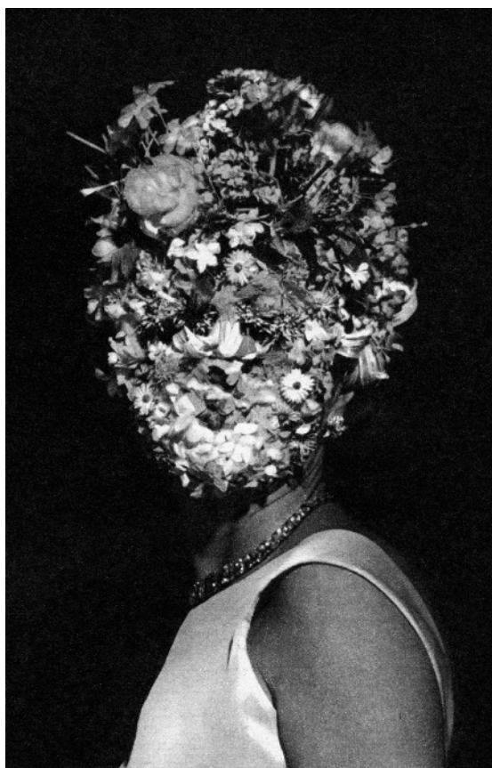
(collective) Sébastien Camboulive

Les Douches la Galerie a le plaisir de présenter Contiguïté , une exposition personnelle de Sébastien Camboulive. Après avoir exposé les séries Spirales en 2008, Visages et La limite pluie-neige en 2013, nous présentons aujourd'hui sa dernière série. Façonnée à partir d'images de presse anciennes, Contiguïté rassemble vingt tirages inédits à travers un récit fait de transmission et de renouvellement.